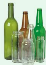
AMPOLLES I POTS DE VIDRE SENSE TAPS.