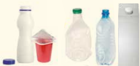
ENVASOS DE IOGURT