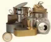
LLAUNES, XAPES, TAPS DE PLÀSTIC I METÀL·LICS