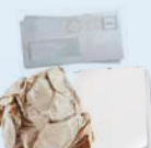
CARTES I PAPER USAT I ESCRIT