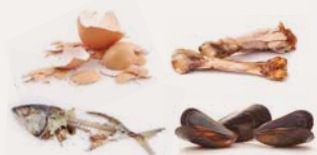
RESTES DE MENJAR