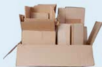
CAIXES DE CARTRÓ PLEGADES